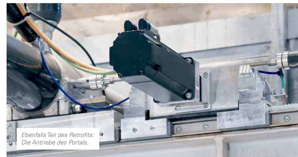
Ebenfalls Teil des Retrofits: Die Antriebe des Portals.