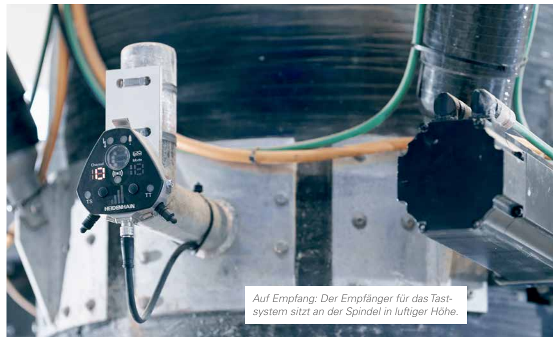
Auf Empfang: Der Empfänger für das Tastsystem sitzt an der Spindel in luftiger Höhe.