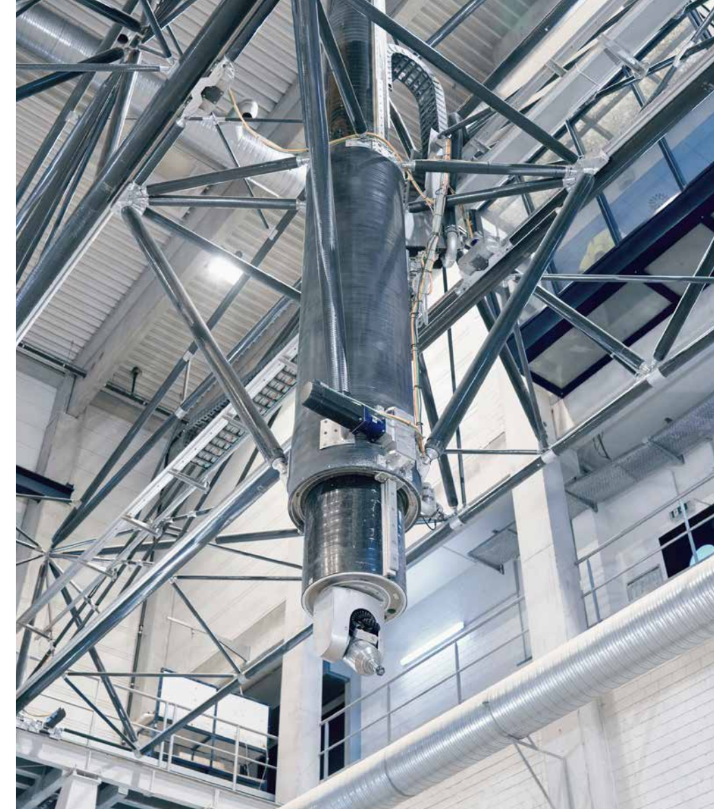
Das rundum erneuerte Portal bearbeitet den unteren Bereich der Werkstücke von ca. 1 m bis 4 m Höhe.

Aber nicht nur die Steuerung wurde im Rahmen des Retrofits ersetzt. Das Retrofit-Team der HEIDENHAIN-Vertretung TEDI erneuerte auch die vier Motoren, die das Portal antreiben. Und die Art, wie die Antriebe auf die Zahnstange wirken – eine Konstruktion, die übrigens bei Tamsen Maritim selbst ent-